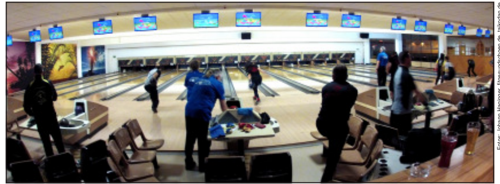
Bis in Pasching wieder gebowlt werden darf, dauert es noch – Atemtraining kann aber schon jetzt beginnen.