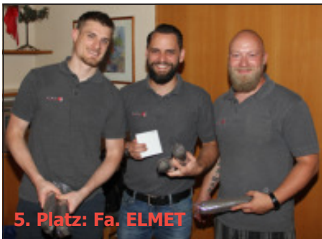
5. Platz: Fa. ELMET