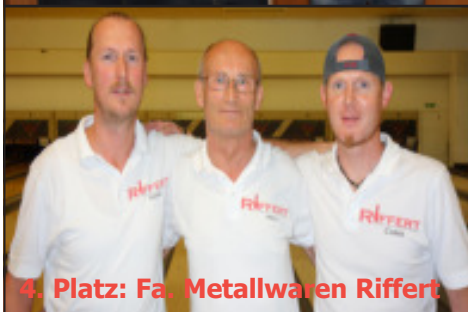
4. Platz: Fa. Metallwaren Riffert