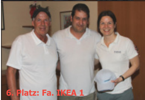
6. Platz: Fa. IKEA 1