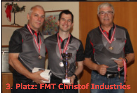
3. Platz: FMT Christof Industries