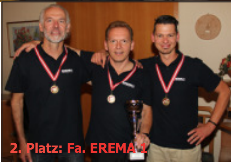
2. Platz: Fa. EREMA 1