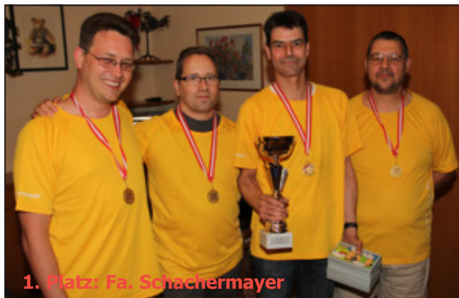
1. Platz: Fa. Schachermayer

● Die Ergebnisse im Detail und weitere Fotos vom Bewerb gibt es auf der Webseite des LVOÖB: www.bowling-ooe.at .