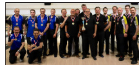
Beispiel: Siegerfoto Team alt (o.) oder neu mit dem derzeitigen Stand der Zustimmung zur Foto-Veröffentlichung (unten).

Soweit die bisherigen Auslegungen zur DSGVO. Zusätzliche Informationen und Antworten auf diverse Fragen gibt es auf der Internetseite der österreichischen Datenschutzbehörde: www.dsb.gv.at .