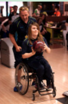
90 Teilnehmer treten in Pasching im Bowling an