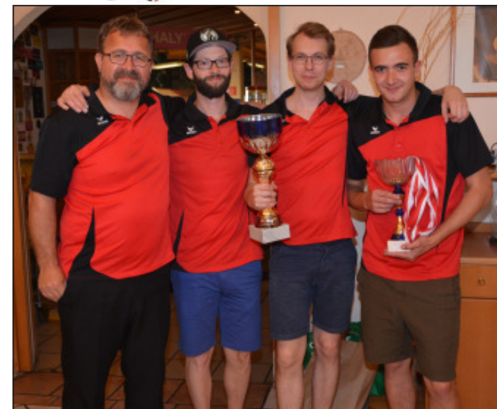
Das Salzburger Team holte sich beim Bundesländervergleichskampf den Gesamtsieg.

Der nächste Bundesländervergleichskampf startet am 8. September, gespielt wird dann statt in Vierer- in Dreier-Teams, mit mehr Teilnehmern je Bundesland.