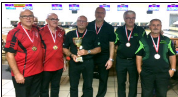
Die Sieger der LM Senioren-Doppel 2016/17