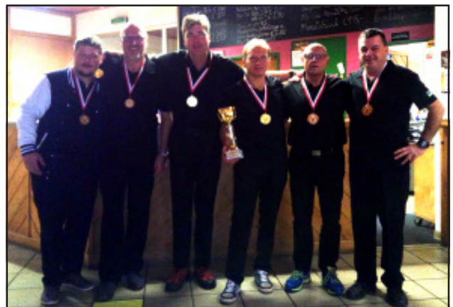
Die Sieger der 1. Klasse: 3 x Linzer BC Diavolo

Impressum: Herausgeber des LVOÖB-Newsletters ist das Referat für Öffentlichkeitsarbeit des LVOÖB. Gestaltung: Grafikstudio Haginger. Der kostenlose Newsletter erscheint online in nicht definierten Abständen. Abo durch Mail mit „Newsletter bestellen“ an kontakt@bowling-ooe.at